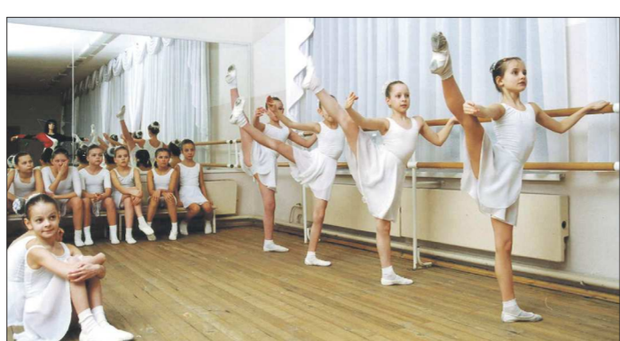
Планируется, что после интенсивных занятий в колледже в будущем юные танцовщицы смогут проходить профессиональную практику в Екатеринбургском театре оперы и балета

Чемпионат 2015/2016 «Синара» начала с двух выездных поражений – от «Дин» (4:8) и в минувшую субботу от «Тюмени» (3:4). После двух туров наша команда занимает непривычное для неё последнее место. Первый домашний матч «чёрно-белые» при поддержке своих самых активных в мини-футбольной суперлиге болельщиков сыграют 16 сентября с дебютантом – клубом «Ухта».