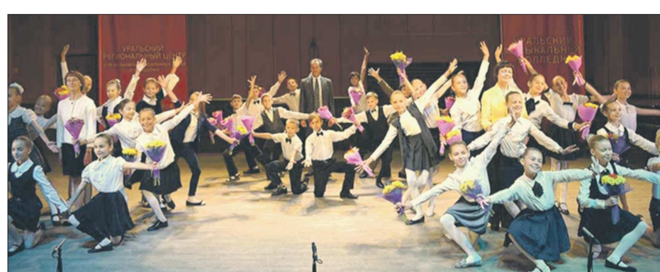
На концерте по случаю открытия хореографического колледжа его ученики исполнили первый совместный танцевальный номер. Преподаватели отметили, что ребята прекрасно держались, а это первый признак того, что балетная сцена им покорится

Места между ребятами из области и города распределены равномерно. В настоящее время у Уральского хореографического колледжа нет сво-