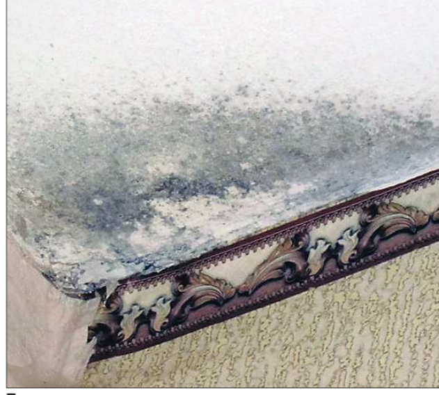
Плесень на потолке и стенах начала проявляться в новых серовских домах по улице Паровозников

Проблема переселения граждан из аварийного жилья в непригодные для жизни новостройки коснулась и Серовского городского округа. Два года назад горожанам из развалившихся барачных втулок вручили ключи от новых квартир, а сегодня они вынуждены заделывать дыры в асфальте дворовых дорог фанерой, соскребать плесень с потолков и затыкать щели в оконных проемах. Власти обещали исправить огрехи, но дело с мертвой точки не движется.