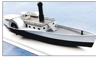
Макет парохода «Тагиль» — в 60 раз меньше затонувшего оригинала

Модель, сделанная из дерева и пластика, получилась небольшой — всего полметра в длину, зато она в точности повторяет конструктивные особенности оригинала и плавает ничуть не хуже.