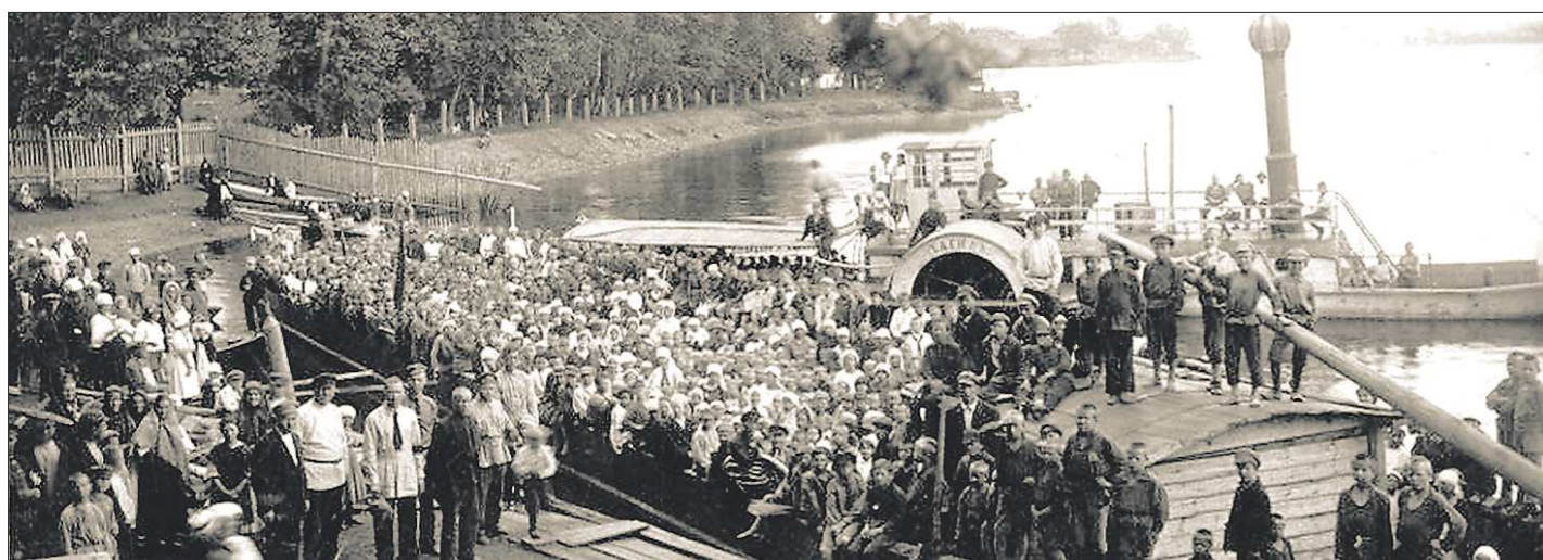
За 80-летний трудовой стаж «Тагиль» сменил несколько мест работы. Его использовали для проводки барж с металлом, а затем — для купеческих прогулок. С 1919 года он начал перевозить пассажиров и стал главной достопримечательностью на городском пруду

Большинство деревень из списка были процветающими, но к девятиности стали приходить в запустение. Так случилось, например, с деревней Кеekorка.