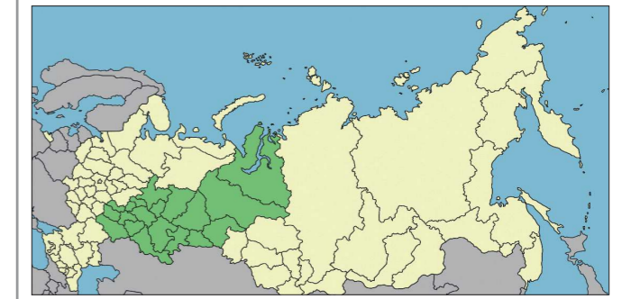
Площадь Приволжско-Уральского военного округа составляла 2 млн 780 тысяч квадратных километров