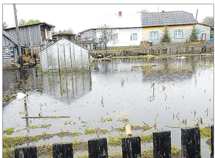
Так сейчас выглядят лобвинские огороды. Очевидно, что большинство посадок не удастся спасти

В прошлую субботу жители после ночной эвакуации добирались до своих домов в резиновых броднях. Сегодняшний уровень воды на улице позволяет ходить в обычных сапогах, но снижается он каждый день не более чем на два сантиметра. Напомним, в конце прошлой недели из-за обильных осадков река Лобва вышла из берегов. В результате оказались подтоплены семь улиц посёлка.