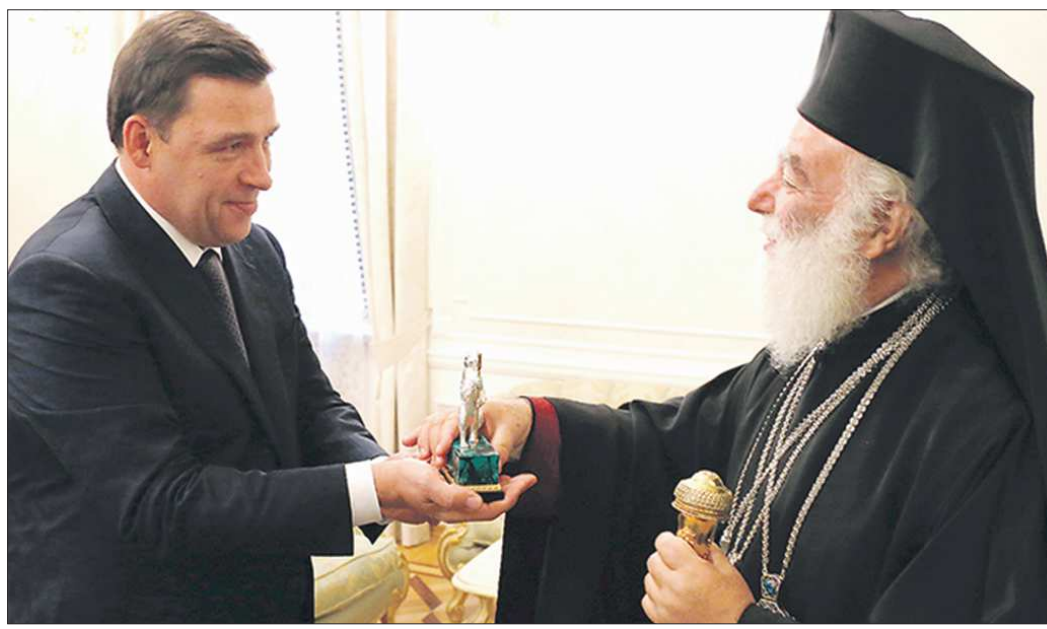
Евгений Куйвашев вручил Феодору II статушку соболя, который изображён на гербе области

свою благодарность за тёплый приём. Я благославления ваш город и область», — сказал Феодор II в ответном слове.