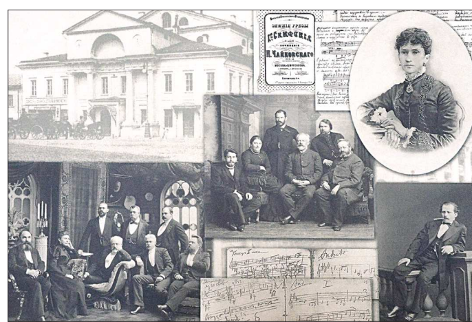
Симфоническое творчество. В центре – композитор с дирекцией Тифлиского отделения Русского музыкального общества

Фотоколлажи иллюстрируют каждый этап жизни мастера.