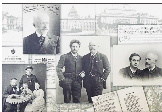
Путешествия Петра Ильича. Фото сделаны в Нью-Йорке, Париже, Монпелье. В центре – с пианистом Александром Зилоти, 1888 год