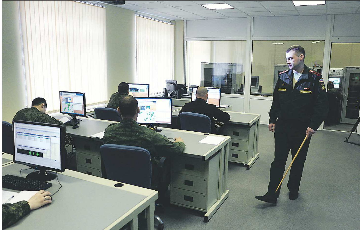
Солдатам научной роты на базе военного учебного центра в Тамбове предстоит разрабатывать новые методы и способы радиоэлектронной борьбы

Спортотряды тоже имеют давнюю историю. Ведь армейские спортивные клубы (от Центрального до окружных СКА) существовали в нашей стране с послевоенных времён. СКА Урала, например, был создан в Свердловске по инициативе тогдашнего командующего войсками Уральского военного округа Маршала Советского Союза Г.К. Жукова в 1948 году. В СКА и ЦСКА откомандировывались лучшие спортсмены-военнослужащие, которые формально (профессионального спорта в СССР ведь не было) считались в штатных расписаниях боевых полков, батальонов и рот, а фактически служили в нештатных спортивных ротках. Окружные СКА в конце 90-х годов прошлого века были расформированы в процессе изъятия армии от несвойственных функций,