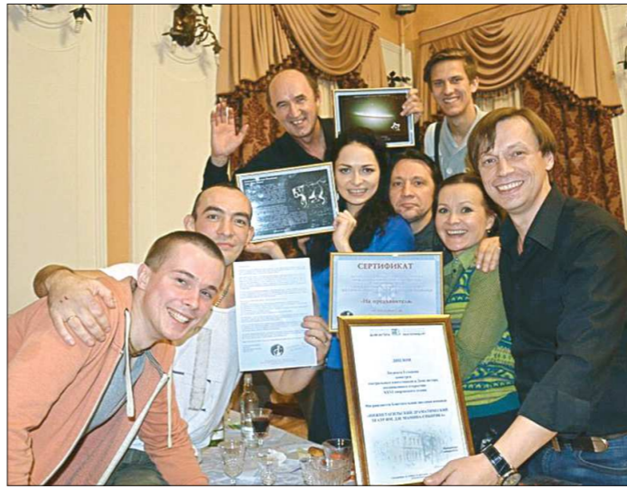
Теперь, глядя в ночное небо, актёры и работники театра ищут взглядом свою собственную звезду. Но найти не могут...