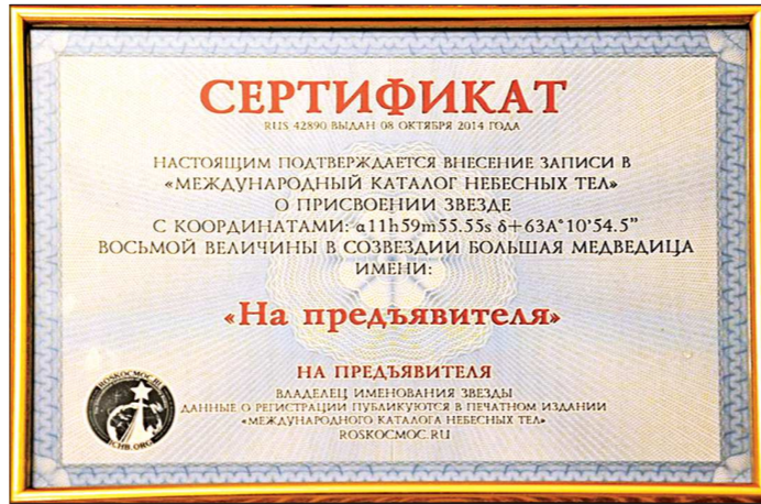
Так выглядит сертификат о присвоении звезде имени, который в прошлом году вручили Нижнетагильскому драматическому театру за победу в конкурсе театральных капутников «Всё о звёздах». В честь победителей якобы была переименована звезда в созвездии Большой Медведицы...

Записали Станислав БОГОМОЛОВ, Александр ПОНОМАРЁВ, Александр ШОРИН