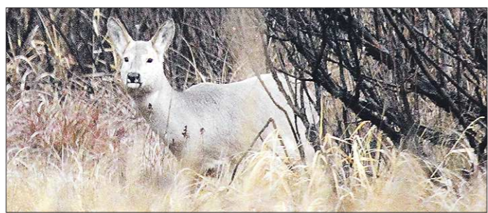
Хорошо живётся косякам в Богдановичском, теперь уже имени А.А.Киселёва, заказнике — и подкоряют в трудное зимнее время, и охотникам сюда путь заказан

Родился он 11 сентября 1934 года в деревне Кайсы Усть-Ишимского района Тюменской области. После школы поступил в ремесленное училище при заводе «Уралхиммаш» в Свердловске, здесь же работал токарем. В 1962 году окончил вечернее отделение Уральского государственного университета по специальности «Биолог-зоолог, учитель биологии и химии средней школы», в 1980 году защи-