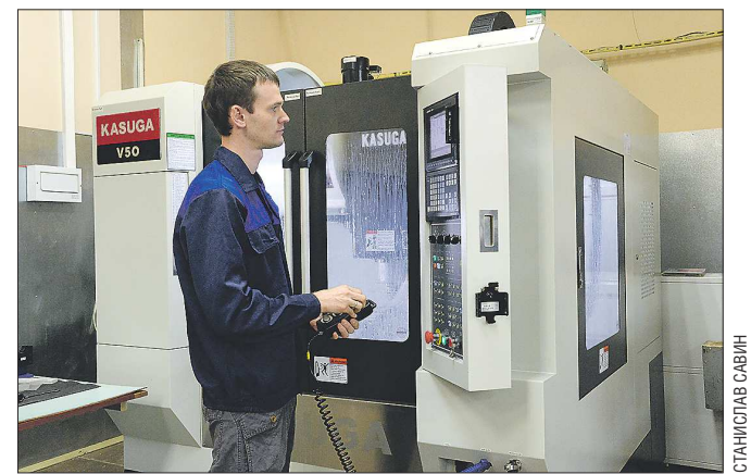
На новое оборудование фирма «Медин-Урал» потратила 20 миллионов рублей, 7 из которых были компенсированы из областного бюджета

— Мало кто знает, что первые свои операции генерал-полковник Святослав Фёдоров делал... осколками лезвий от бритвы «Нева», — продолжает Егоров. — Сегодня с той же целью используются скальпели с алмазной режущей кромок. С помощью тако-