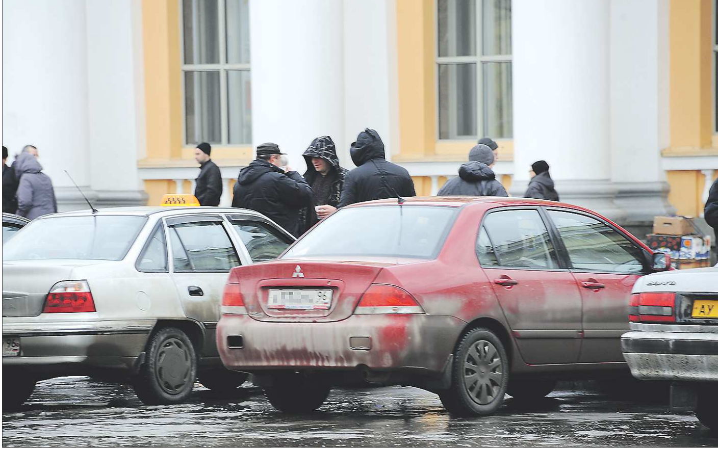
Конкуренция на рынке такси огромная. Только индивидуальных предпринимателей-таксистов в Свердловской области больше 19 тысяч

Казаюсь бы, вот он — тот самый свободный рынок, о котором мы мечтали, где здоровая конкуренция ведёт к снижению цен. Однако не всё