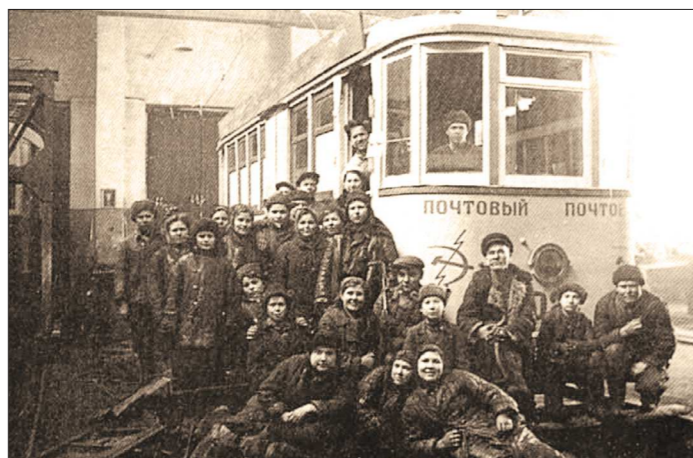
В 1943 году, из-за увеличения потока корреспонденции, почта был выделен почтовый трамвай, который заходил во двор Дома связи (ныне Главпочтамт). Почту разгружали на остановках вблизи отделений связи и дальше везли на тележках или санках, а до адресатов корреспонденцию доносили почтальоны

В Екатеринбурге открылась выставка «Несём Победу!», посвящённая работе свердловских почтальонов в годы Великой Отечественной войны. Посетители смогут увидеть там уникальные фотографии почтальонов 40-х годов, почтового трамвая, который доставлял корреспонденцию в Свердловске, и фронтовые «треугольники».