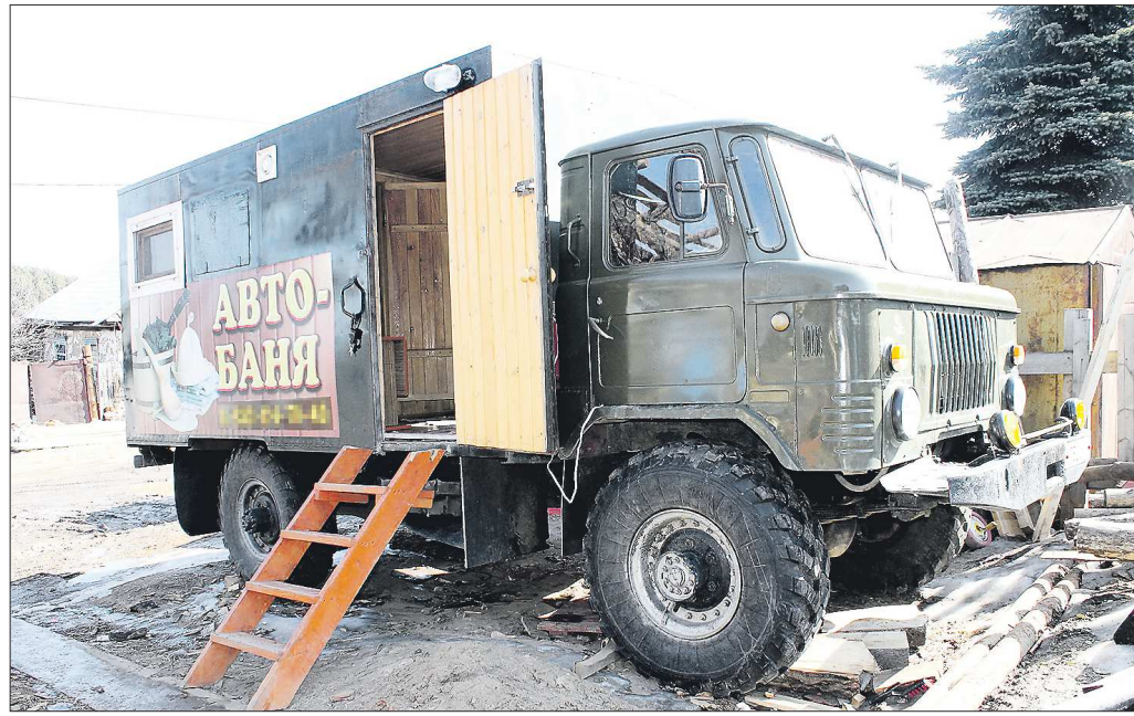
Так баня на колёсах выглядит снаружи...

Судя по комментариям в соцсетях, у общественности сложилось два полярных мнения. Одни считают, что житель поступил правильно, а другие уверены, что самовольный ремонт может быть опасен для автолюбителей, поскольку кирпичи могут вылететь из ямы и попасть в глаза идущий транспорт. Так или иначе, жители Большого Истока состоянием дорог недовольны — асфальт разваливается даже около поселковой больницы. Жалуются и на пугубное состояние покрытия на улице Горького: там в сырую погоду нельзя не только ездить, но и ходить пешком, потому что огромные лужи грязи трудно обойти.