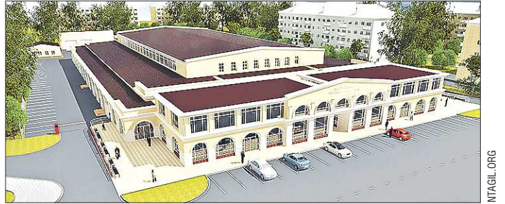
К этому образцу, утверждённому в мэрии, стремятся при проведении реконструкции владельцы рынка