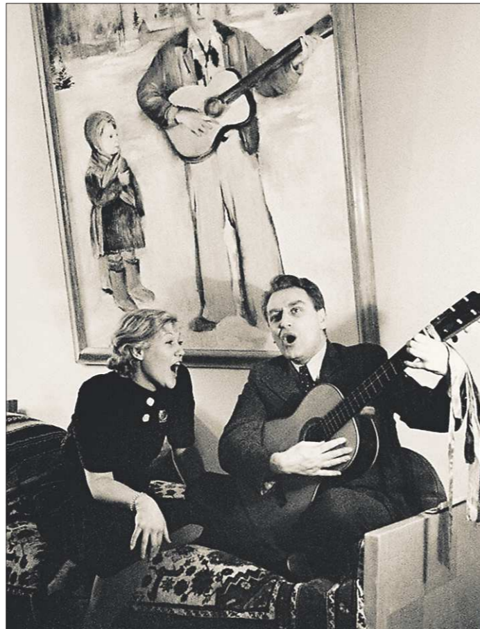
Любовь Орлова и Григорий Александров: настоящие (фото 1937 года)...

Кинорежиссёр Григорий Александров, подаривший миру «Волгу-Волгу» и «Весёлых ребят» и зажжённый одну из главных звёзд отечественного кино Любовь Орлову, родился и 18 лет прожил в Екатеринбурге. Но родной город к своему великому сыну оказался странно равнодушен: в столице УрФО нет ни памятника Александрову, ни улицы его имени, ни мемориальной доски