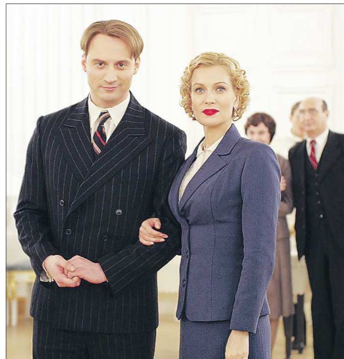
...и киношные (кадр из российского сериала, только что показанного по телевидению)

Кинорежиссёр Григорий Александров, подаривший миру «Волгу-Волгу» и «Весёлых ребят» и зажжённый одну из главных звёзд отечественного кино Любовь Орлову, родился и 18 лет прожил в Екатеринбурге. Но родной город к своему великому сыну оказался странно равнодушен: в столице УрФО нет ни памятника Александрову, ни улицы его имени, ни мемориальной доски