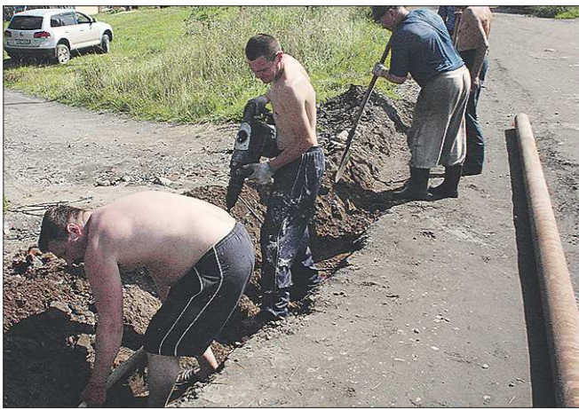
Нижняя Салда. 2014 год