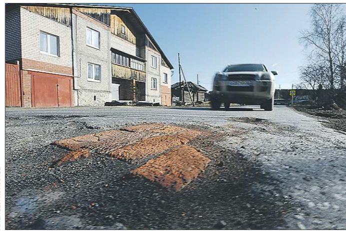
Большой Исток. 2015 год

Летом прошлого года жители посёлка Большой Исток, проживающие на улице Демьяна Бедного, узнали о том, что ремонт проезжей части у них будет нескоро, взяли инициативу в свои руки и отремонтировали дорогу сами (отремонтировали, кстати, получше ных «профессионалов» — дорога служит до сих пор).