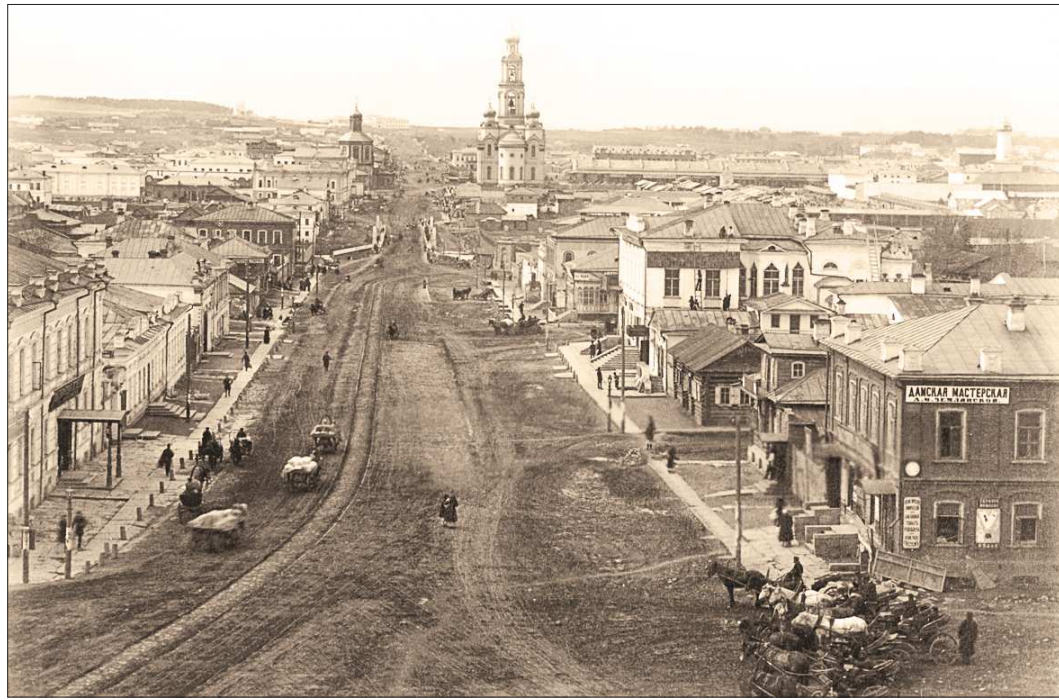
Екатеринбург, 1890 год. Взгляд Вениамина Метенкова...