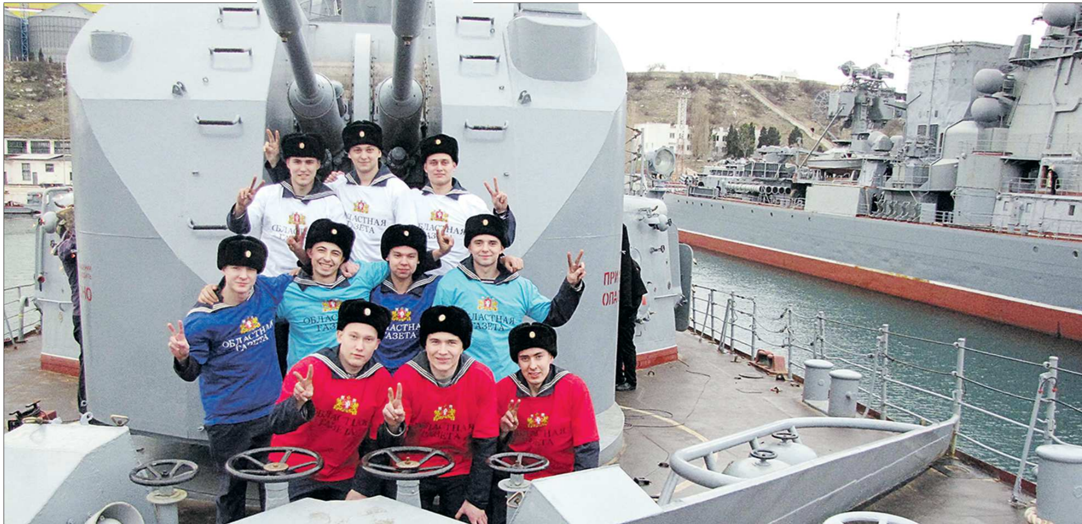
Как видно на снимке, корреспондент «ОГ» прибыл на корабль не с пустыми руками, а привёз в подарок землякам фирменные футболки газеты. Обратив внимание на цвета футболок, ребята решили выстроиться в соответствии с российским триколором