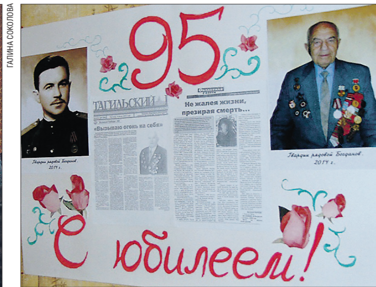
Родные подготовили для ветерана поздравительный плакат с вырезками из изданий, которые в разные годы о нём писали — «Областной газеты» и «Тагильского рабочего»