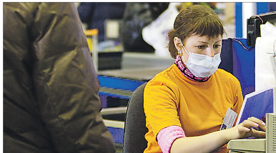
Люди, работающие в сфере услуг, особенно тщательно должны соблюдать правила безопасности в период эпидемии ОРВИ, ведь один продавец, кондуктор или водитель общественного транспорта может за пару дней заразить тысячи человек

Сейчас в УК «Пассажирские транспортные перевозки» более сразу шесть водителей, чуть меньше в компании «Экспресс-сити». Их отсутствие уже ощутили пассажиры второго, четвёртого, пятого и шестнадцатого маршрутов. Интервал движения автобусов теперь больше, чем положено по расписанию. Ежедневно в Каменске-Уральском на линию выходит 92 автобуса. Резерва водителей, которые бы могли подменить заболевших коллег, нет, а перевозить пассажиров,