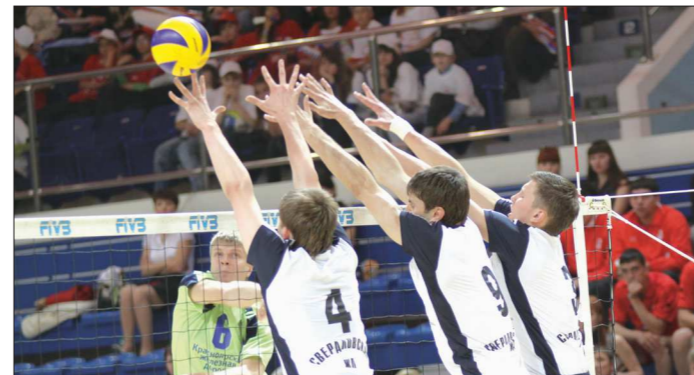
Неприступный некогда блок «Локомотива-Изумруда» в последние годы чаще даёт сбои

У фигуристов есть шутка: если на вопрос «что такое тулуп» человек описывает предмет гардероба, значит — «не свой». Вы же теперь смело можете говорить: «Это такой зубцовый прыжок, на который заходят обычно с тройки...»