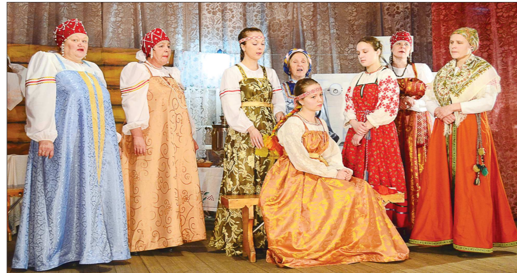
Перед венчанием у невесты отнимали косу — но не отрезали, а всего лишь расплетали. Это был символ отнимания девичьей красоты и подготовки девушки к семейной жизни

Но были различия в свадебном фольклоре и обрядах даже в рамках Горнозаводского округа. Например, после первой брачной ночи в Пригородном районе муж выносил молодую на руках к гостям и после этого начиналось всеобщее веселье, в Верхнесалдинском принято было бить посуду, в Невьянском — бить посуду и пить красное вино, а в Алапаевском — надо было «честь искать», то есть посмотреть рубашку невесты в бане, в Камен-