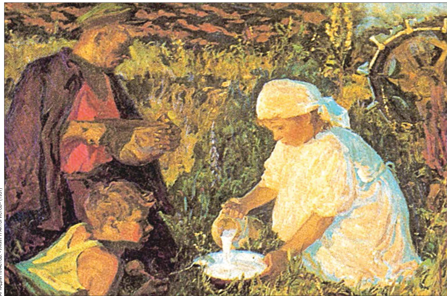
АРКАДИЙ ПЛАСТОВ. «ЖИВНТРАКТОРОВ» (1951)