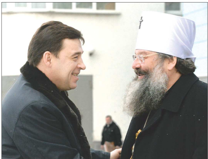
Губернатор Евгений Куйвашев (слева) поздравил митрополита Екатеринбургского и Верхотурского Кирилла с 130-летием епархии

Для меня особенно важна высокая и ответственная миссия церкви по укреплению нравственности и духовности общества, воспитанию уральцев на идеалах добра, справедливости, милосердия, сострадания к ближнему, упрочению межнационального и межконфессионального согласия и мира в нашем регионе, – подчеркнул губернатор. – Мы гордимся, что была возрождена духовная жемчужина Урала – древ-