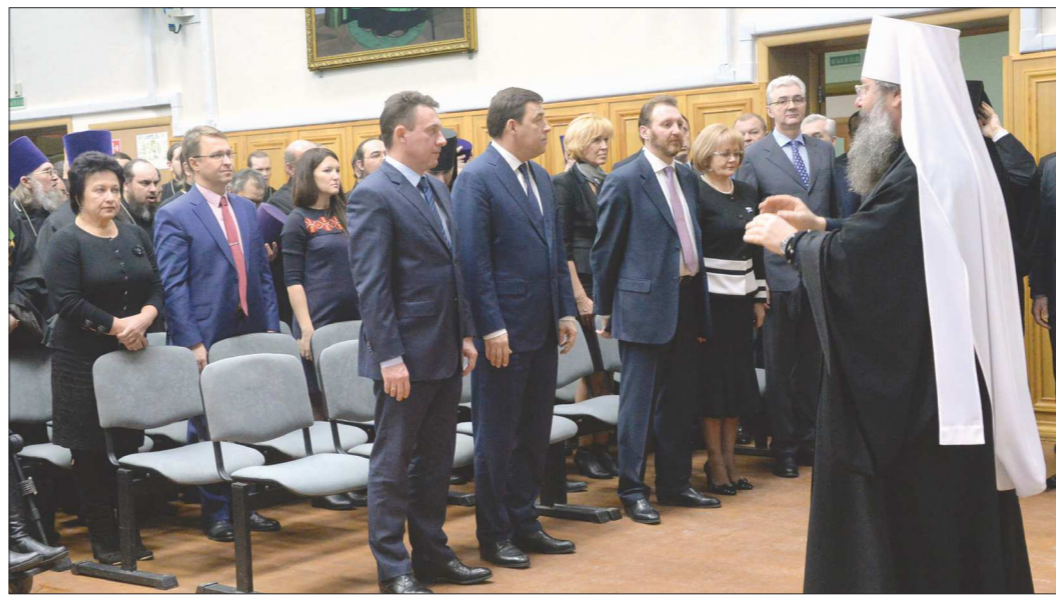
Юбилей епархии собрал в одном зале всю элиту Свердловской области