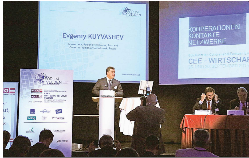
Евгений Куйвашев выступил на открытии VI Австрийского экономического форума

Кроме того, между Свердловской областью и австрийской землёй Штирия (её административным центром и является Грац) будет подписано соглашение о торговом экономическом, научно-тех-