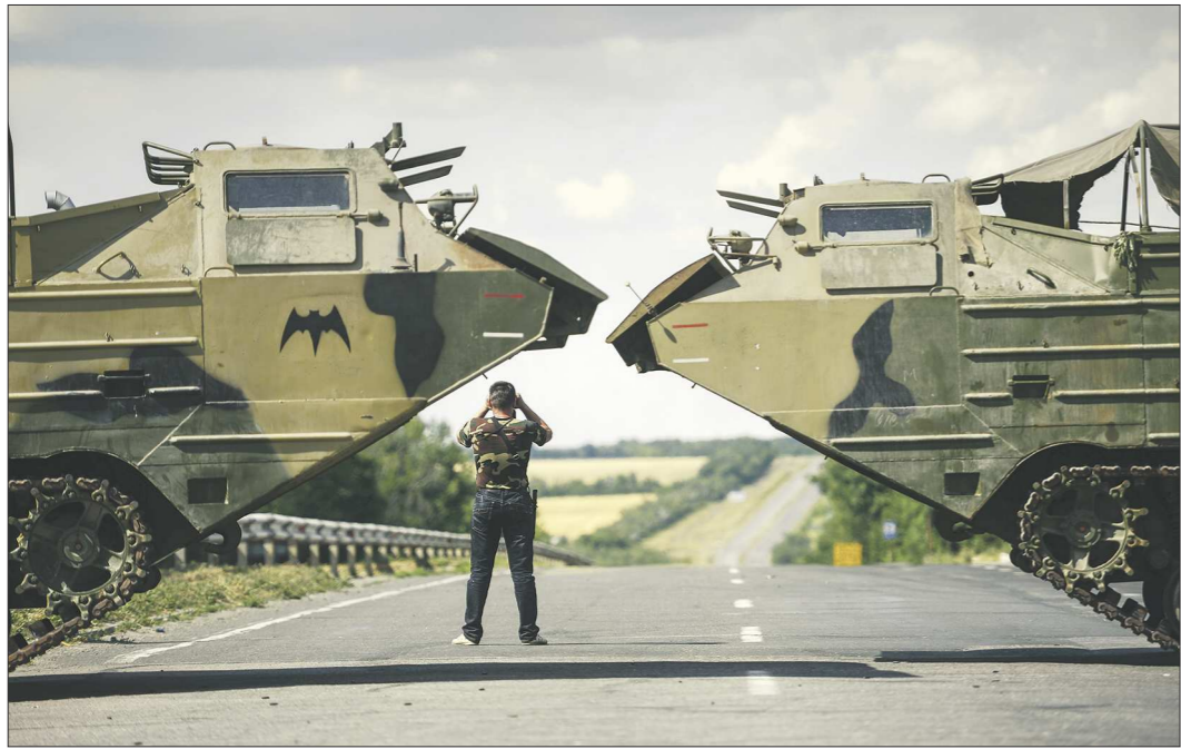
Боец ополчения на окраине Луганска после артиллерийского обстрела посёлка Металлист. Апрель, 2014 год