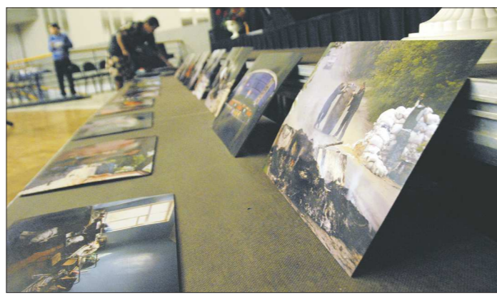
122 фотографии формата А3 – в фотосалоне за их распечатку запросили крупную сумму. Однако, узнав, что это для выставки с войны, владелец салона, пожелавший остаться анонимным, сделал весь заказ за свой счёт