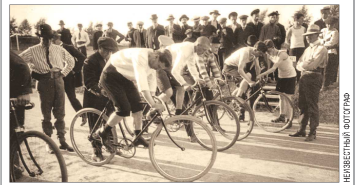
Велосипедно-атлетические соревнования, начало XX века