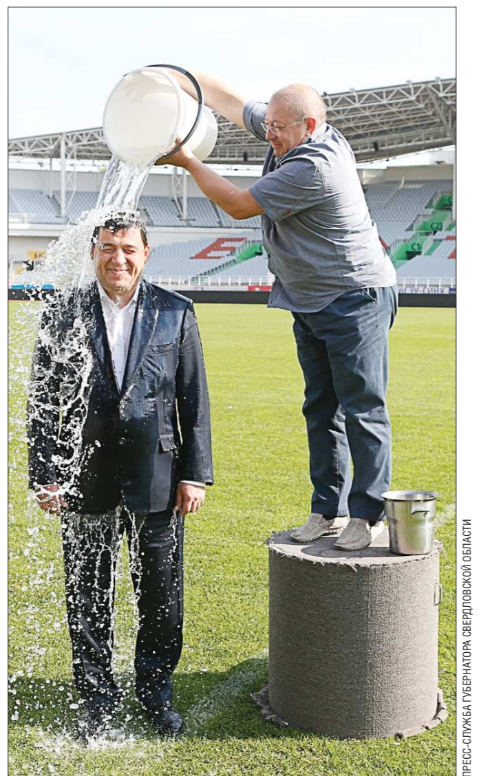
ПРЕСС-СЛУЖБА ГУБЕРНАТОРА СВЕДЛОВСКОЙ ОБЛАСТИ