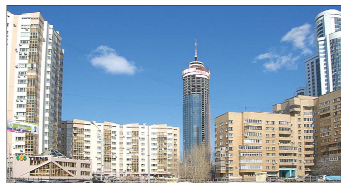
Несмотря на непростую экономическую ситуацию, Средний Урал переживает строительный бум

На фоне сложной ситуации в промышленности, когда многие предприятия сообщают о снижении прибыли, такой внушительный рост в строительной отрасли, безусловно, радует. Причём я должен сказать, что это результат целого комплекса факторов. Общая площадь многоквартирных домов, которые сей-