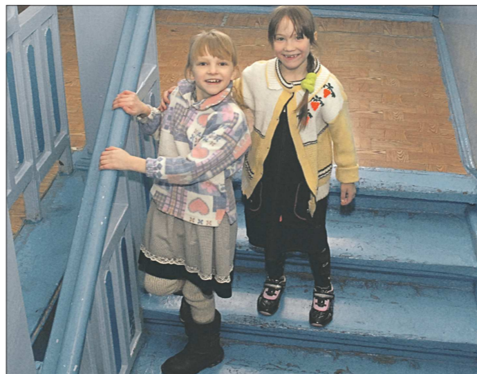
В деревенских школах дети пока ещё могут оставаться в группах продлённого дня до 17.00 – 18.00 совершенно бесплатно

Нынче школ, решивших взимать с родителей плату за присмотр детей после уроков, стало в разы больше. Дело в том, что закон гарантирует бесплатное образование в рамках стандарта: уроки по плану и 10 часов внеурочной работы. Группы продлённого дня отнесены к услугам по содержанию ребёнка, а значит, превы-