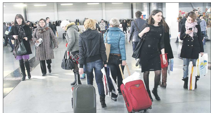
Летний обвал на туристическом рынке почти не повлиял на стремление россиян отдохнуть за границей