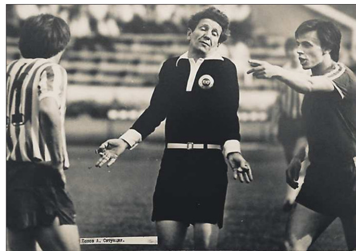
Спорная ситуация в игре — момент всегда самый эмоциональный.