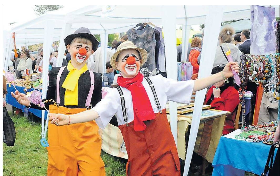
На Ирбитской ярмарке испокон веку было шумно, интересно, весело