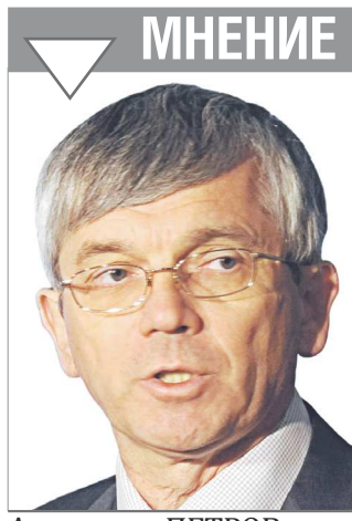
Александр ПЕТРОВ, депутат Государственной думы РФ