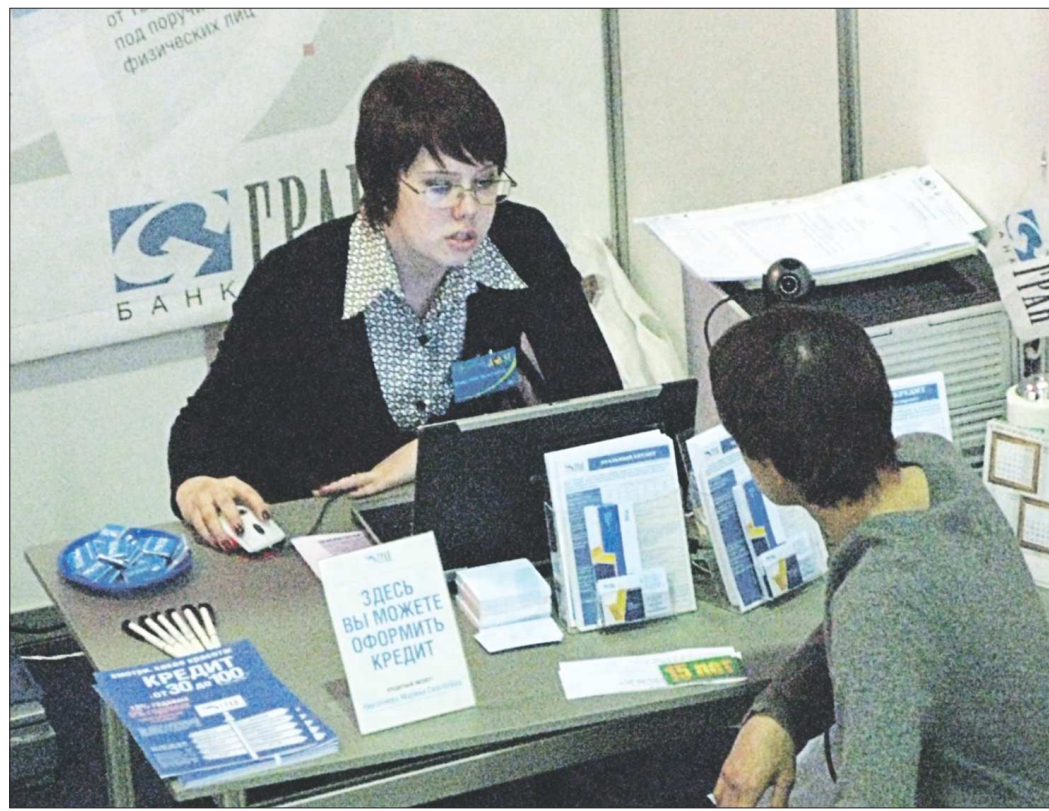
За год просроченная задолженность по потребительским кредитам выросла в области с 4,2 процента до 5,3 процента

Качество портфеля потребительского кредитования банков в большой степени зависит от экономики. Наша экономика в 2013 году находилась не в самом лучшем состоянии, - говорит заместитель председателя Уральского банковского союза Евгений Болотин. - Тем не менее люди продолжали активно брать кредиты, сказывался эффект