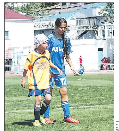
Екатеринбургские спортсменки сильно уступали соперницам в росте, но это не помешало им выиграть