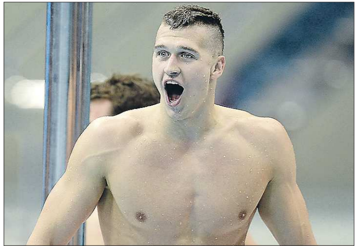
Теперь в коллекции свердловского пловца четыре медали чемпионатов Европы — две золотых и две серебряных