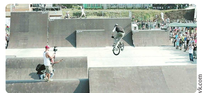
«Горизонт» позволит проводить в Свердловской области крупные соревнования по экстремальным дисциплинам