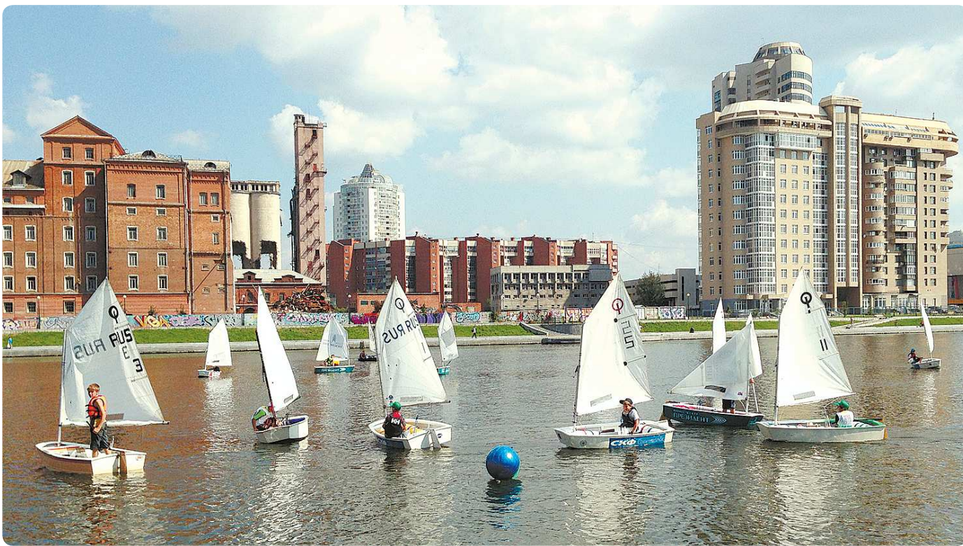
У нового яхт-клуба «Повелитель паруса» есть своя группа в «ВКонтакте»: https://vk.com/lordofthesail

До ближайшего к Екатеринбургу моря — около трёх тысяч километров. Местные водоёмы из-за климатических условий большую часть года находятся в замёрзшем состоянии. Тем не менее столица Урала считается одним из мировых центров парусного спорта. На это есть ряд причин: во-первых, в Екатеринбурге строят собственные яхты; во-вторых, на акватории городского пруда летом проводятся международные регаты (например, недавно завершившаяся «ЯВА-Трофи»); в-третьих, тут воспитывают спортсменов. Редакция «НЭ» решила заглянуть на тренировку в недавно открывшийся в самом центре города детский яхт-клуб «Повелитель паруса», чтобы выяснить, кто и зачем рассекает водную гладь Исети?