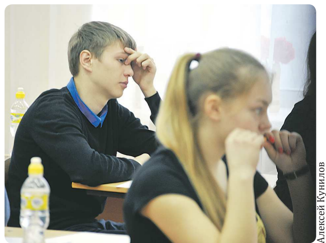
Школьники уже и не знают, чего им ждать от ЕГЭ завтра