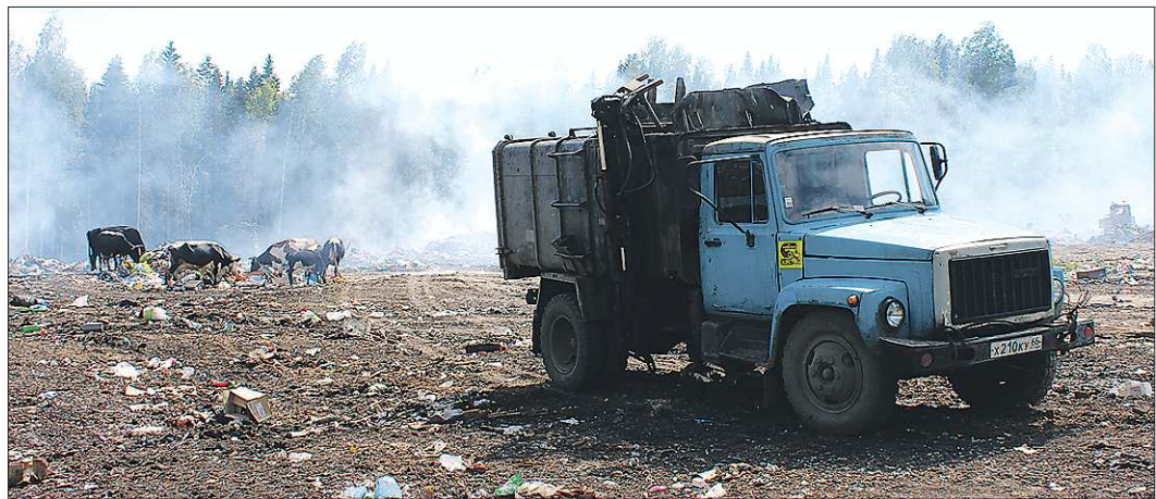
Коровы на шалинской свалке радостно встречают местные мусоровозы и спешат «к столу»

Через несколько дней была объявлена война с Германией и мобилизация за мобилизацией стала уводить людей из нашего села на защиту нашей дорогой матушки России».