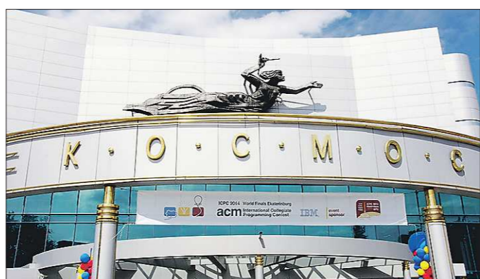
Церемония открытия чемпионата прошла в киноконцертном театре «Космос»