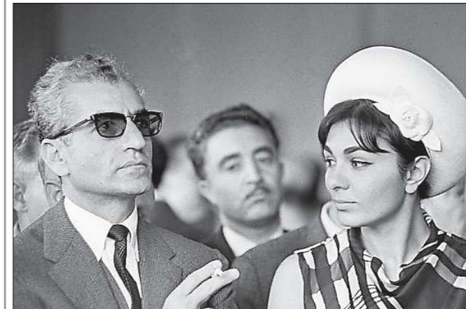
Уральцам во время этого визита запомнился не столько сам шах, сколько его жена Фарах, которая одеждой и манерами очень напоминала Жаклин Кеннеди