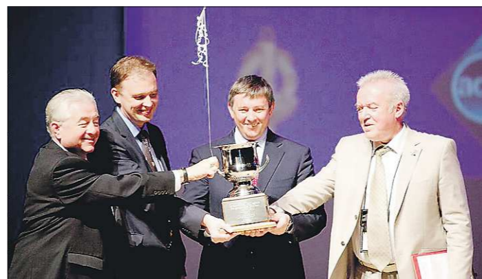
Организаторы чемпионата демонстрируют кубок, который получит команда-победительница