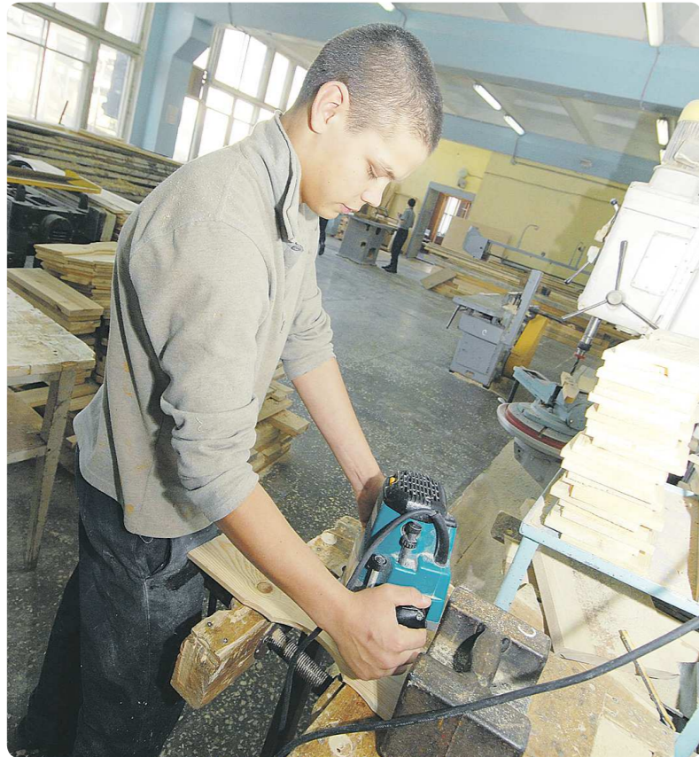
Студентам ПТУ любая работа по плечу. Они и деталь на станке выточат...

По сравнению с 2010 годом количество абитуриентов, желающих получить среднее специальное образование, выросло на 14 процентов