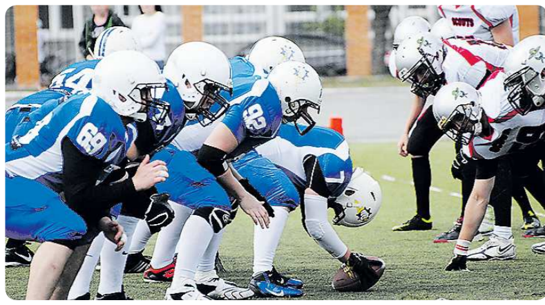
Екатеринбургская команда «Уральские молнии» (слева) обыграла челябинских «Южноуральских скаутов» (справа) со счётом 55:0

У нас в стране этим видом спорта занимается около трёх тысяч спортсменов. Ежегодно проводится чемпионат России, в котором принимают участие 25–30 команд