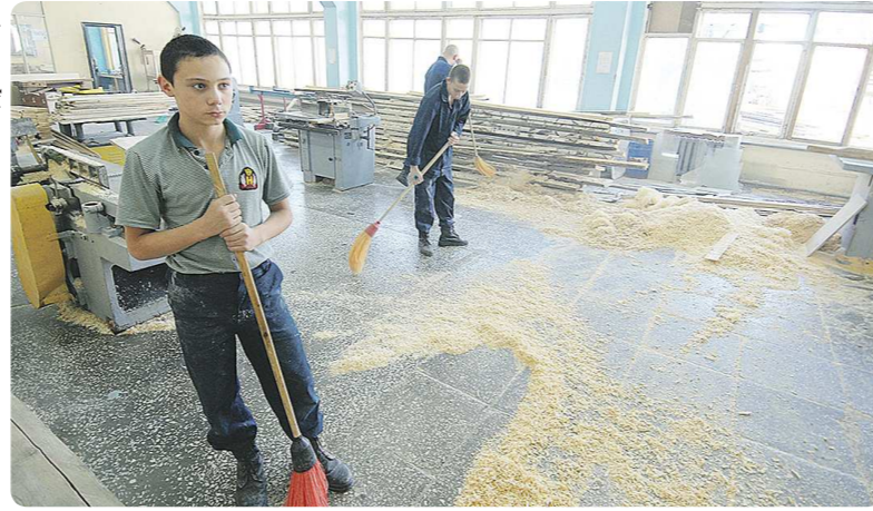
...и рабочее место за собой уберут

По всей России стартовала очередная приёмная кампания. Большинство выпускников школ уже определились с выбором специальности и места, куда подадут документы. Глядя на своих знакомых менеджеров, юристов, психологов, обивающих пороги кадровых агентств, всё больше старшеклассников начинают осознавать, что путь к успеху лежит вовсе не через высшее, а через среднее специальное образование. Спрос на рабочие профессии сегодня высок как никогда, а имидж профессионального училища как пристанища для двоечников и хулиганов, заваливших школьные экзамены, стремительно уходит в прошлое. Редакция «НЭ» решила выяснить, кто поступает в уральские техникумы, колледжи и училища и какие перспективы их ждут после выпуска?