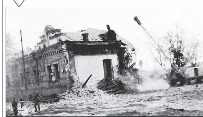
Добываясь сноса дома Ипатьева, Юрий Андропов, скорее всего, не знал, что этот особняк, возможно, связан не только с последним российским императором. Историки предполагают, что в расстреле царской семьи участвовал будущий венгерский лидер Имре Надь (который как австрийский военнопленный оказался в те годы на территории России). В 1956 году в Венгрии Юрий Андропов сделал всё, чтобы на смену заявившему о выходе из Варшавского договора Имре Надыо пришло дружественное Советскому Союзу правительство. Без танков это оказалось невозможно...

«ЦК КПСС. Секретно. О сносе особняка Ипатьева в городе Свердловске. Антикоммунистскими кругами на Западе периодически инспирируются различного рода пропагандистские кампании вокруг царской семьи Романовых, и в этой связи нередко упоминается бывший особняк купца Ипатьева в г. Свердловске. Дом Ипатьева продолжает стоять в центре города. В нём размещается учебный пункт областного управления культуры. Архитектурной и иной ценности особняк не представляет, к нему проявляет интерес лишь незначительная часть горожан и туристов. В последнее время Свердловск начали посещать зарубежные специалисты. В дальнейшем круг иностранцев может значительно расшириться и дом Ипатьева станет объектом их серьёзного внимания.