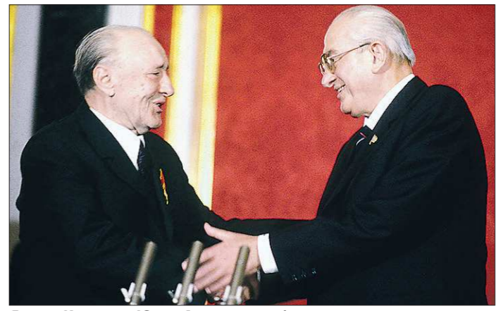
Яноша Кадара и Юрия Андропова объединяли не только воспоминания о драматических событиях 1956 года. Оба они понимали необходимость перемен в своих странах. Но действовали предпочли совершенно по-разному

Вопрос о том, куда бы двинулось советское общество, проживи Андропов дольше, был предметом раздумий не одного исследователя. Пошло бы развитие страны по китайскому варианту? По-горбачёвскому?