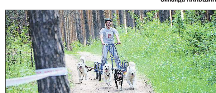
Дог-картинг — зрелищный вид спорта, аналог зимней езды на собаках

Как рассказывает сысертская газета «Маяк», «лето обгоняли собаководы» из Екатеринбургa, Ханты-Мансийска, Тюмени, Нижнего Тагила, Кировграда и самой Сысерти. Гонка объединила несколько дисциплин: бег с собаками в упряжке, езда на велосипеде с одной или двумя собаками, просто бег с питомцем. «Экспидит» для новичков и детские старты. Организовали соревнования члены екатеринбургского клуба северных ездовых собак при поддержке сысертских предпринимателей и чиновников.