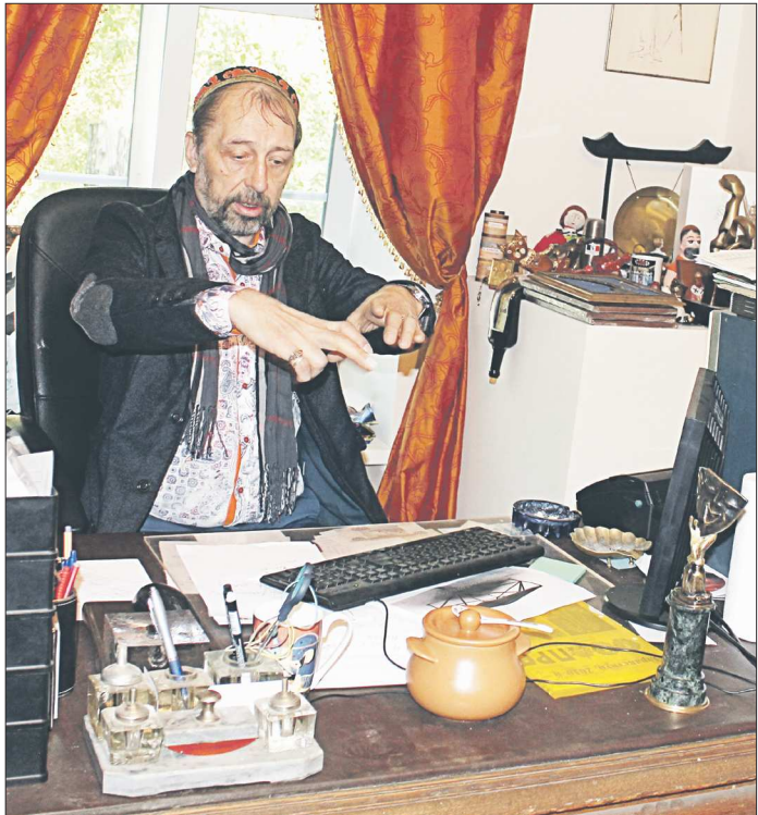
Николай КОЛЯДА, художественный руководитель «Коляда-театра»

На вашем рабочем столе идеальный порядок? Или, напротив, из-за ненужных бумаг вы вечно не можете найти тот единственный, самый нужный документ? А может, к беспорядку на столе и вовсе нужно относиться творчески?