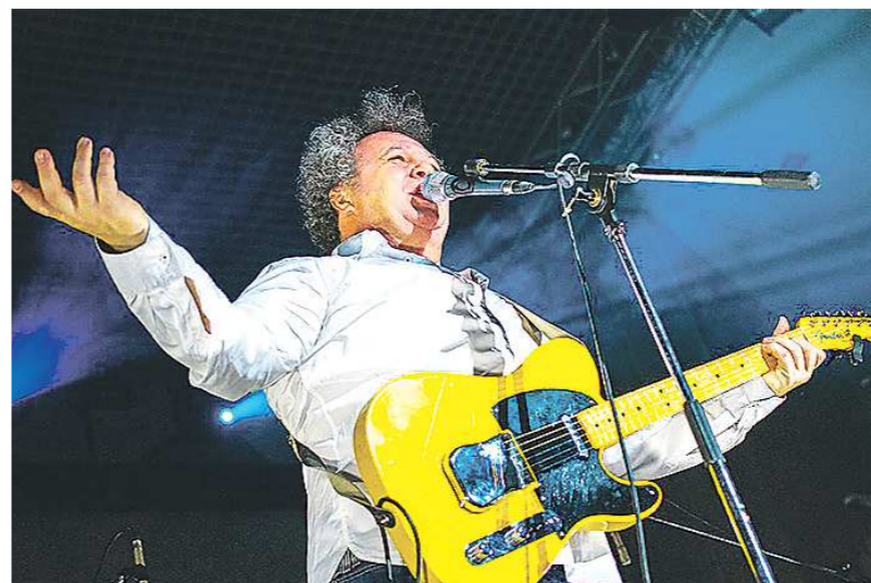
Евгений Горенбург был в благостном расположении духа и сам предложил в афишу больше двадцати молодых групп