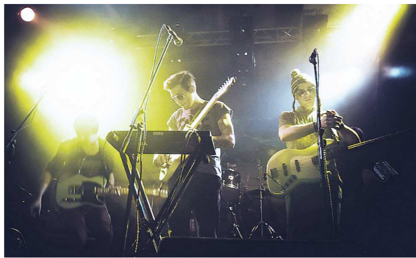
Группа «ПАТИ» из Воронежа — одна из немногих, чьё звучание смогли оценить прямо на заседании. Эксперты оживились: «Надо же, какую хорошую музыку играют!»

Вопрос с немедленным расширением премьер-лиги (за счёт крымских или других российских команд) в следующем сезоне закрыт. Если и будет увеличиваться наш элитный дивизион, то не ранее чем через год. И вот это безусловно правильно. Спешка могла бы испортить футбольный праздник, а будущее у крымского футбола, несомненно, есть.