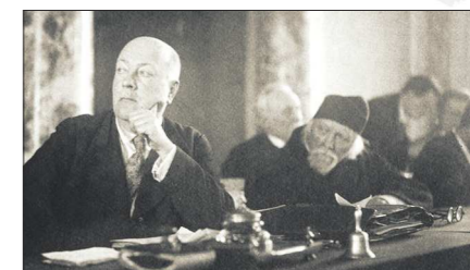
Слева – академик Александр Ферсман, возглавлявший Уральский филиал АН СССР, правее – академик Александр Карпинский

В 1932 году в Свердловске начала работу выездная сессия Академии наук СССР во главе с её президентом академиком Александром Карпинским.