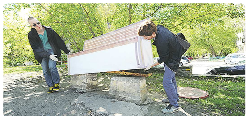
Скамейку установили по адресу: улица Энгельса, 85. Жители дома используют её по назначению

Лёгкое замешательство испытала жителя Екатеринбурга, которые стали свидетелями очередной акции уличного художника Славы РТРК «Видимость». Молодой человек создал девять различных макетов реальных объектов, которые очень часто встречаются в городском пространстве, и установил их в самых людных местах столицы Урала. Теперь в центре Екатеринбурга можно наткнуться на ненастоящий светфор, бутафорскую скамейку, брезентовый биотуалет и даже картонный автомобиль. Конечно, главный вопрос, который мучает многих — для чего городу такие декорации?