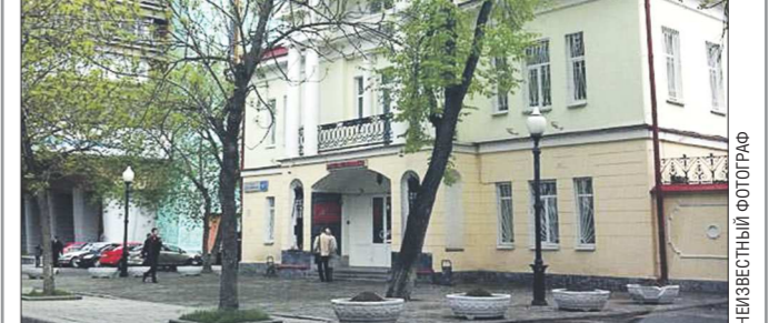
Сегодня здание первой советской сберкассы Екатеринбурга занимает военный комиссариат Свердловской области