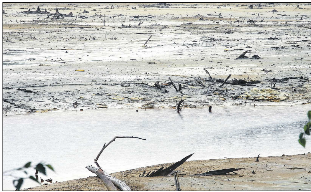
Эта вода отравлена если не навсегда, то надолго