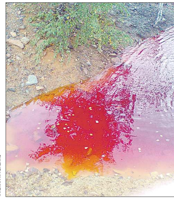
Вот так кислота выжигает всё живое вокруг