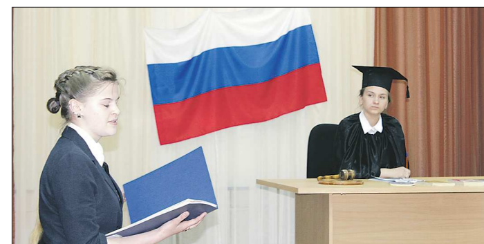
«Адвокат» красноречив, «судья» строг. Всё как в жизни