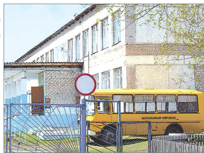
Автобус привёз ребят в школу села Невьянского после майских праздников, теперь он будет простаивать до следующей субботы