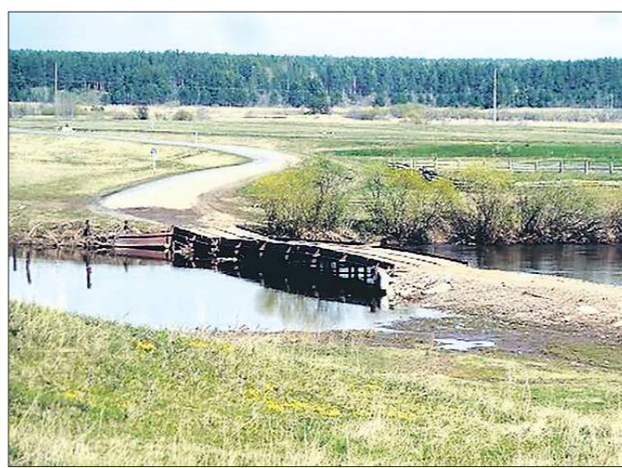
Старый мост между Невьянским и Первоуновской служил и транзитной межрайонной магистралью. Этот снимок сделан осенью. Сейчас переправа, как обычно, ушла под воду