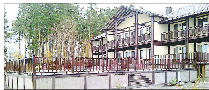
Прокуратура требует снести веранды, пристроенные к зданию базы отдыха. Они, как выявила проверка, расположены на особо охраняемой территории парка

Вчера в Сысертском районном суде началось рассмотрение иска межрайонной прокуратуры, которая требует сноса самовольных построек на берегу Верх-Сысертского пруда. Ущерб, нанесённый окружающей среде несанкционированным строительством, надзорное ведомство оценивает в 17 миллионов рублей.