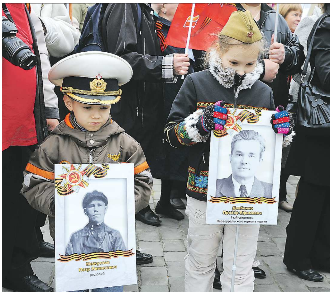
Уже второй год подряд 9 мая после парада войск Екатеринбургского гарнизона по площади 1905 года проходит «Бессмертный полк». Несколько тысяч уральцев несут портреты своих дедов и бабушек, прадедов и прабабушек, воевавших на фронтах Великой Отечественной войны и ковавших Победу в тылу