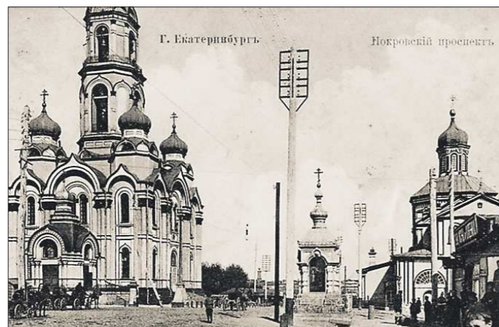
1910 год. Большой и Малый Златоусты. Размеры Большого Златоуста составляли 32 метра в длину и 24,5 метра в ширину.