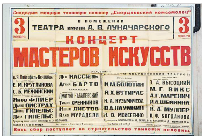
Концерты столичных и местных звезд помогли не только поднять боевой дух в тылу, но и построить целые танковые колонны

— Самый любимый фильм о войне — «Провер-