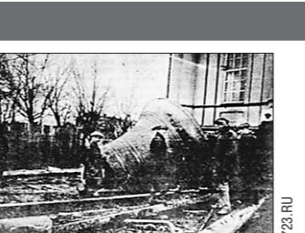
Снятие 16-тонного купола, того самого Большого Златоуста

Строили, кстати, долго — 29 лет. Несмотря на то, что первоначальный грандиозный проект так и остался на бумаге, получившийся результат прижогли оценили.