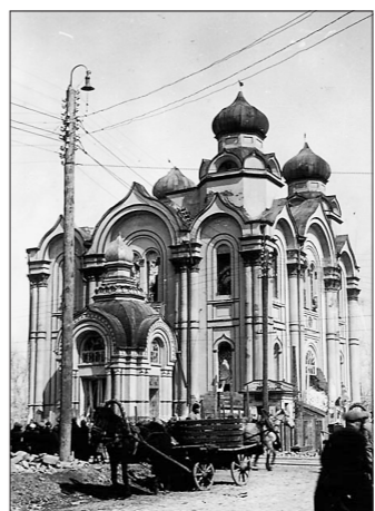
1930-й. Уже обрушена колокольня. Жить храму осталось несколько месяцев...

Большой Златоуст простоял чуть больше полвека. В 1920-м подвалы помещения церкви были заняты городскими властями под овощехранилище.