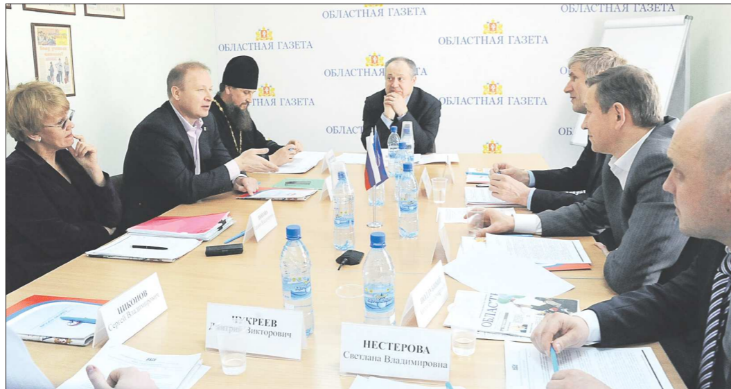
Обсуждение ужесточения правил торговли алкоголем, которое прошло в «ОГ», стало самым представительным

Федеральное законодательство о регулировании производства и оборота алкоголя даёт право регионам вводить в этой сфере собственные запреты. Областное правительство подготовило проект постановления «Об установлении на территории Свердловской области дополнительного ограничения времени, условий и мест розничной продажи алкогольной продукции». Этот документ обсудили участники «круглого стола», состоявшегося в редакции «Областной газеты».