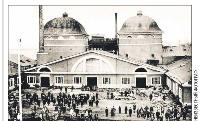
Баранчинский электромеханический завод в первые годы работы