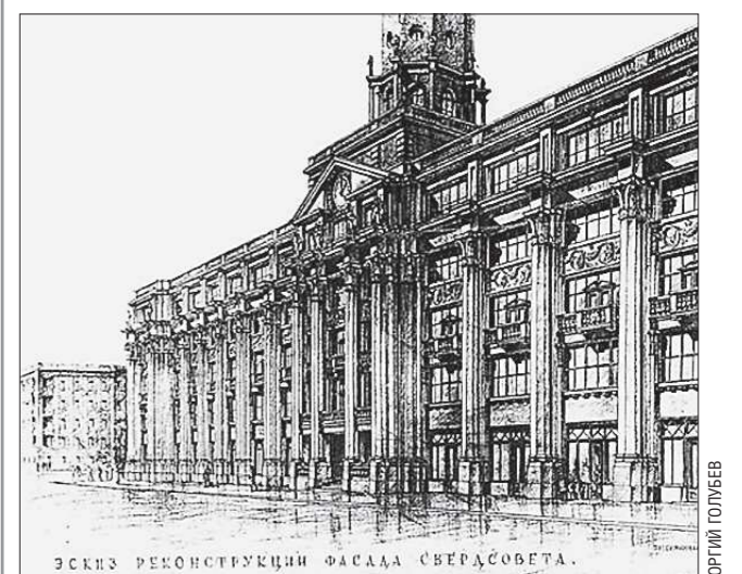
А это — эскиз, на котором здание уже имеет знакомый нам вид