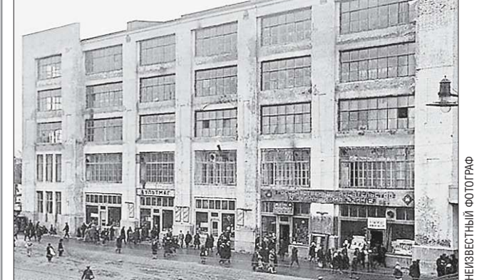
Так выглядело здание Свердловсета до 1947 года

Работы по реконструкции фасада начались два года спустя — в 1947-м, и затянулись на несколько лет, так как средства выделялись небольшими частями. Леса, окружавшие здание, дважды в год разбирались — на празднование 1 мая и 7 ноября, а затем вновь собирались.