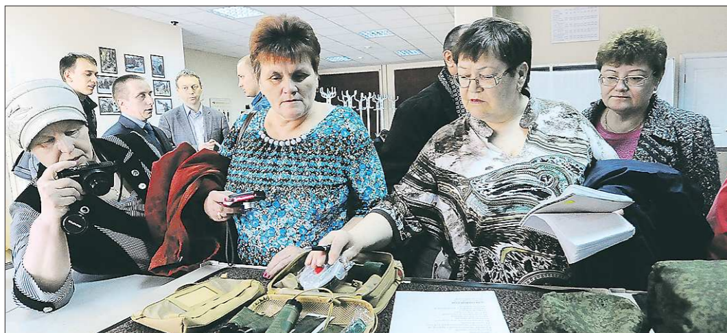
Такого любящего «звезда» в Егоршино ещё не было. Комитет солдатских матерей изучает главную новинку весеннего призыва — гигиенический набор. В каждом таком чемоданчике 17 предметов: от шампуня до... бальзама для губ