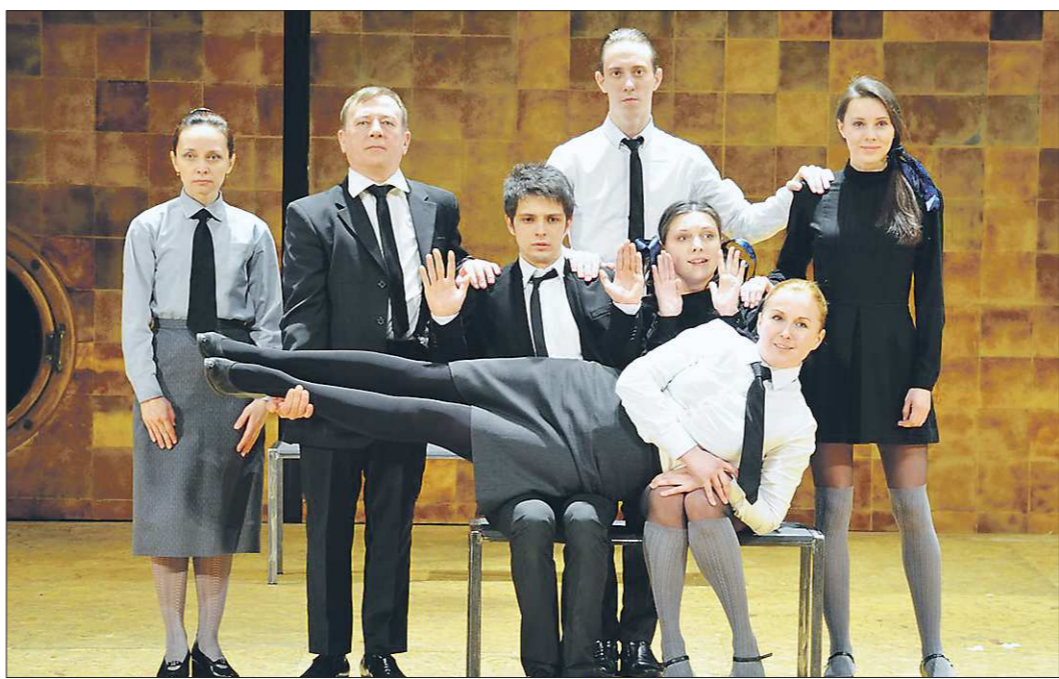
Фото с генерального прогона в Драмтеатре. Репетиция прошла без единого сбоя, что бывает далеко не всегда

Главный вопрос, ответ на который ищет Мирзоев — откуда берётся зло. В какой момент в светлом и искреннем ребёнке оно вдруг рождается? Эпиграфом к спектаклю режиссёр выбрал цитату философа Григория Померанца: «Дьявол начинается с пены на губах ангела, вступившего в бой за святое и правое дело». Герои никому не желают зла — просто совершают случайные поступки — механи-