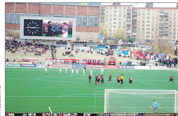
На пермском стадионе «Звезда» проводит домашние матчи местный «Амкар»