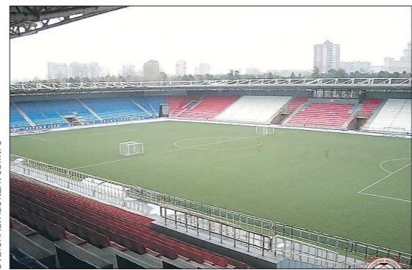
На Центральном стадионе Челябинска в 2010 году уложен новый газон