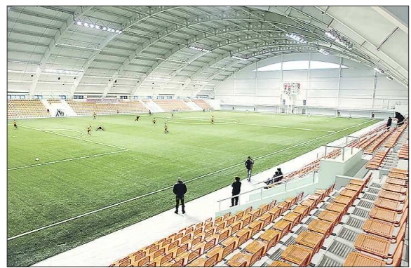
Екатеринбургский манеж уже принимал матчи премьер-лиги