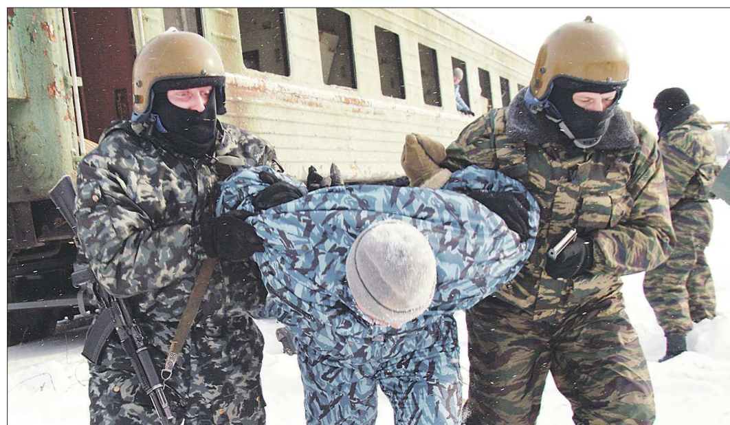
На всякую силу есть сила покуче. Хотя... это только учения

Загорелись идеей сделать добро и тоже хотите помочь слабому? Организаторы предлагают либо написать об этом на электронный адрес center.iniciativy2013@yandex.ru , либо звонить по телефону (343) 336-42-05.