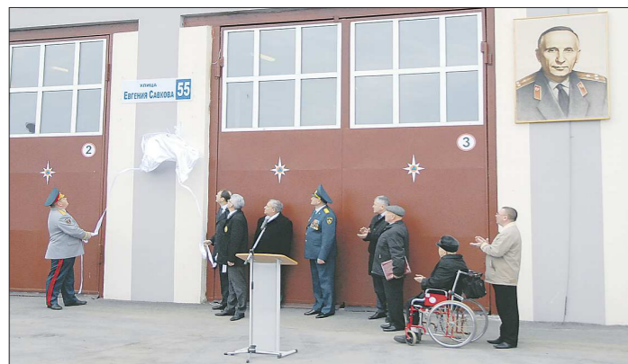
Адресные таблички «ул. Евгения Савкова» появились на 13 зданиях бывшей улицы Суходольской. И первая из них — на пожарной части. Жилых домов здесь пока нет