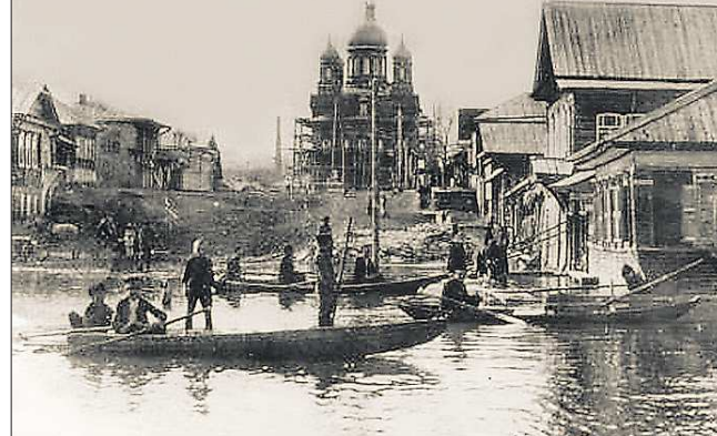
А вот так выглядел Красноуральск ровно сто лет назад, во время наводнения 1914 года

В 80-х годах XX века берега реки Уфы в черте Красноуральска были подняты и укреплены, и с тех пор катастрофические наводнения прекратились.