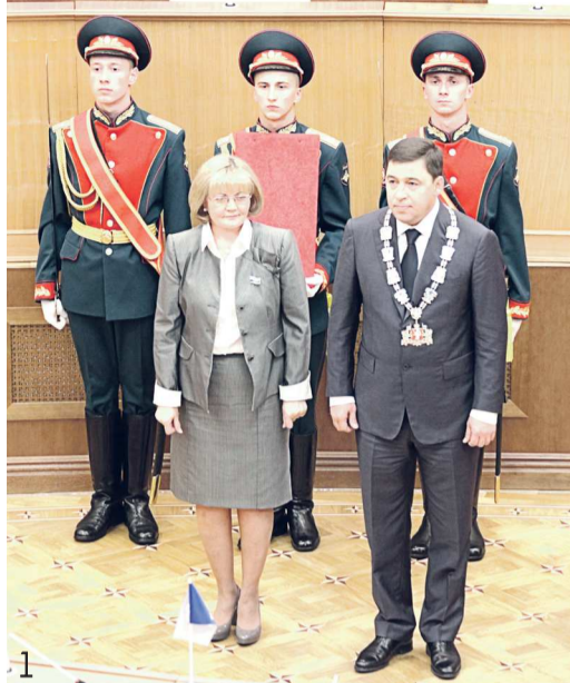
1. 2012 год: инаугурация губернатора Свердловской области Евгения Куйвашева, рядом с ним – председатель Законодательного Собрания Свердловской области Людмила Бабушкина

Депутат Палаты представителей от Асбестовского одномандатного избирательного округа № 1, член комитета по экономической политике, бюджету, финансам и налогам (апрель 1996 г. – апрель 1998 г.). Депутат Палаты представителей от Асбестовского одномандатного избирательного округа № 1, заместитель председателя Палаты представителей (апрель 2000 г. – март 2004 г.). Депутат Палаты представителей от Асбестовского одномандатного избирательного округа № 1, заместитель председателя комитета по промышленной, аграрной политике и природопользованию (март 2004 г. – март 2008 г.). Депутат Палаты представителей от Асбестовского одномандатного избирательного округа № 1, председатель комитета по социальной политике (март 2008 г. – июль 2011 г.). Полномочия прекращены досрочно в связи с назначением на госдолжность.