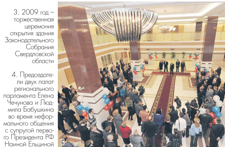
3. 2009 год – торжественная церемония открытия здания Законодательного Собрания Свердловской области