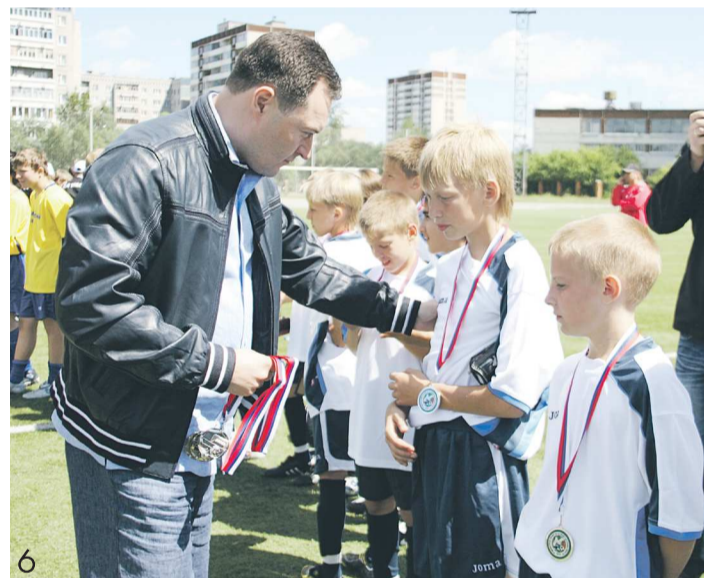
6. Депутат Александр Серебрянников многое делает для развития юношеского спорта